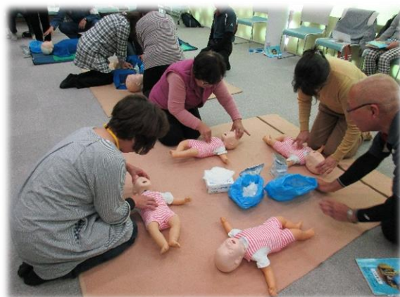
【平成29年度の講習会の様子】

ご確認いただきお申し込みの上、是非ご参加ください。お申し込みはお早めをお願いいたします。